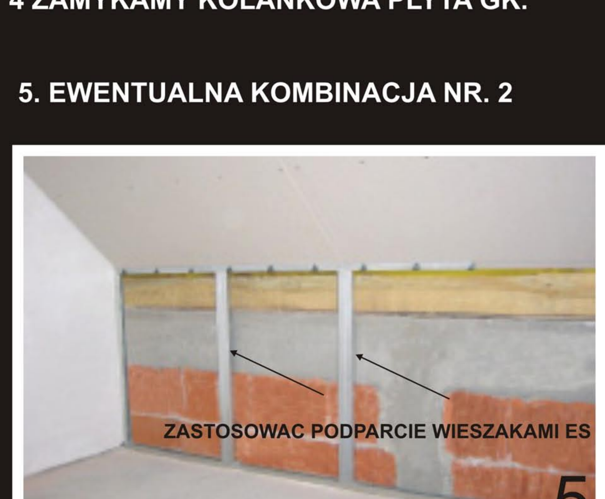
ZAMKNIĘCIA TE STOSOWAĆ TYLKO W PRZYPADKU GDY NIEMOŻLIWE BYŁO POSTAWIENIE ŚCIANKI KOLANKOWEJ W PIERWSZEJ KOLEJNOŚCI