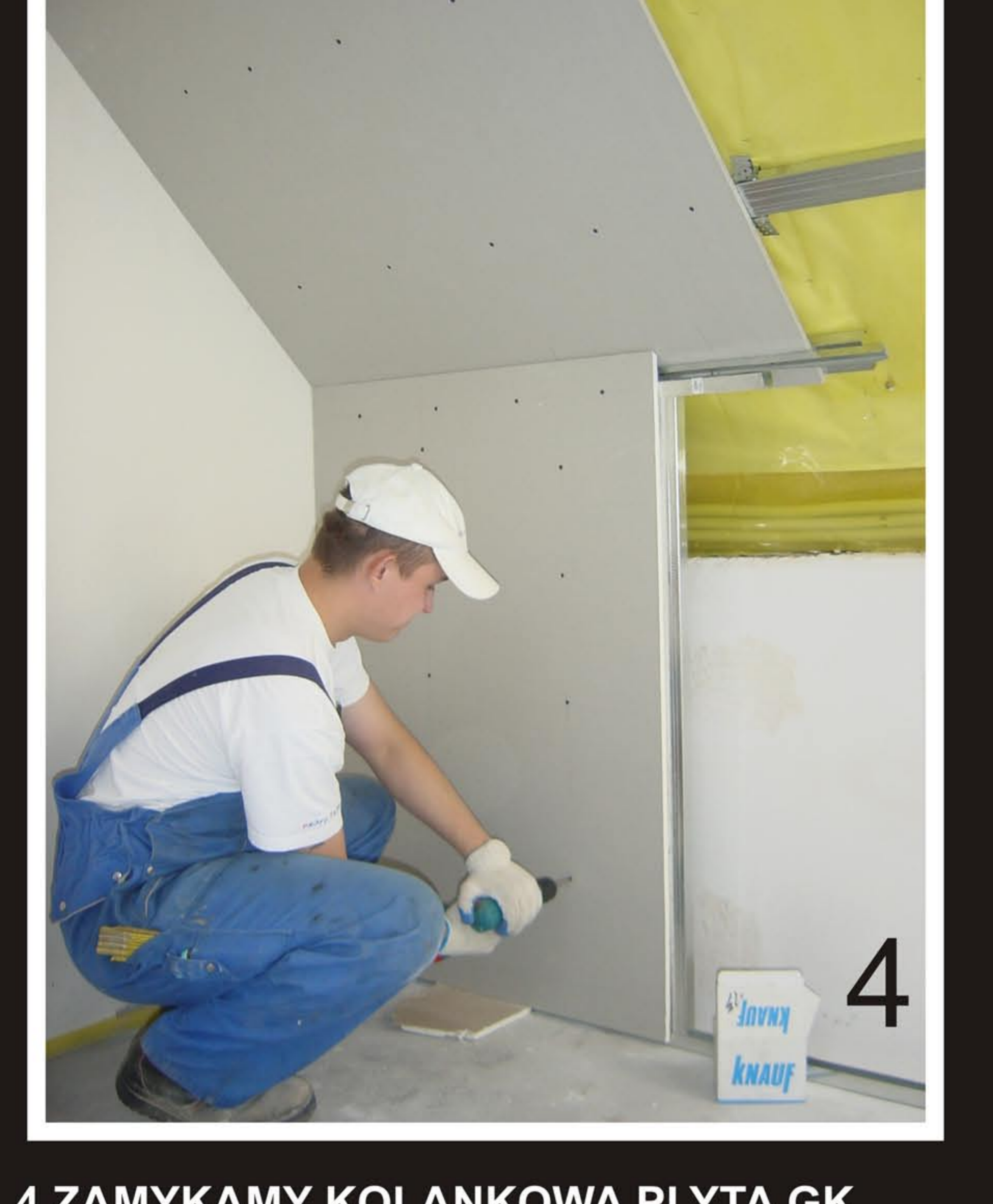
4 ZAMYKAMY KOLANKOWA PLYTA GK.