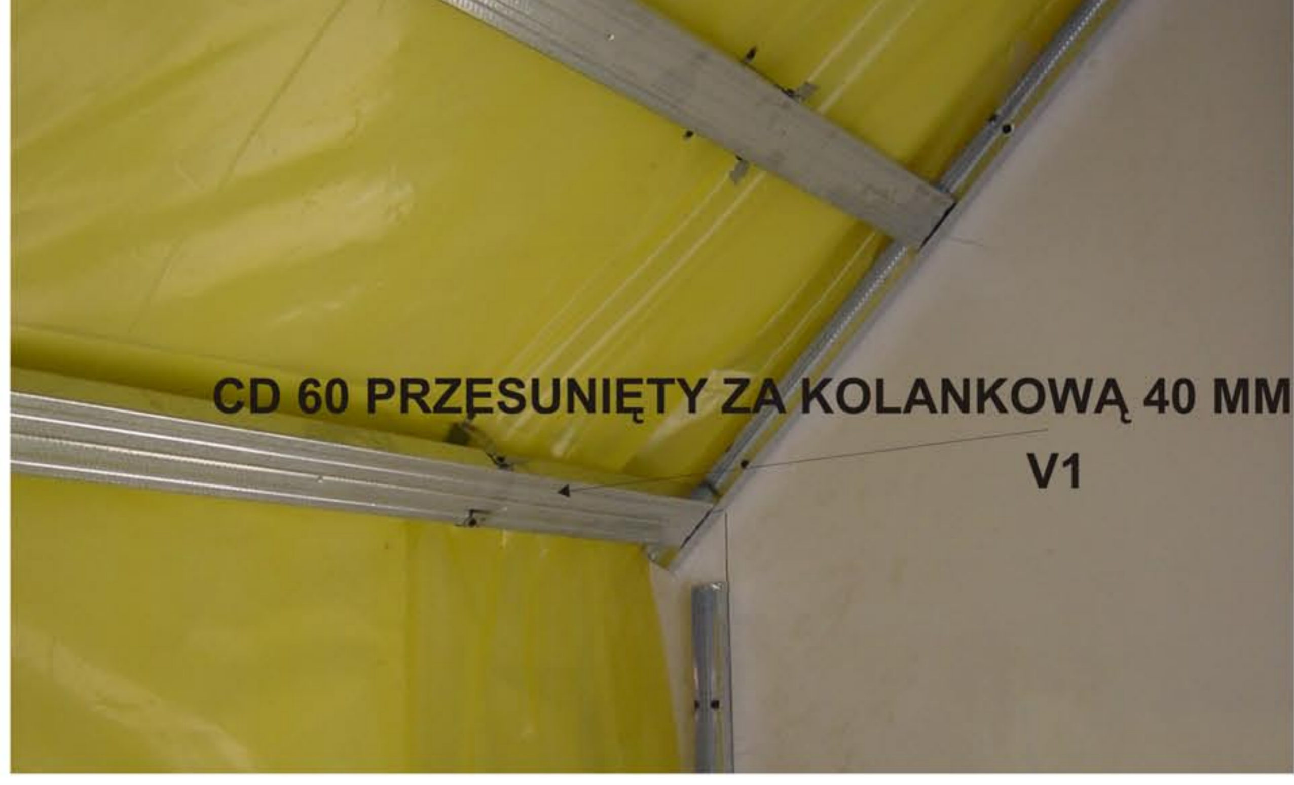
CD 60 PRZESUNIĘTY ZA KOLANKOWĄ 40 MM V1