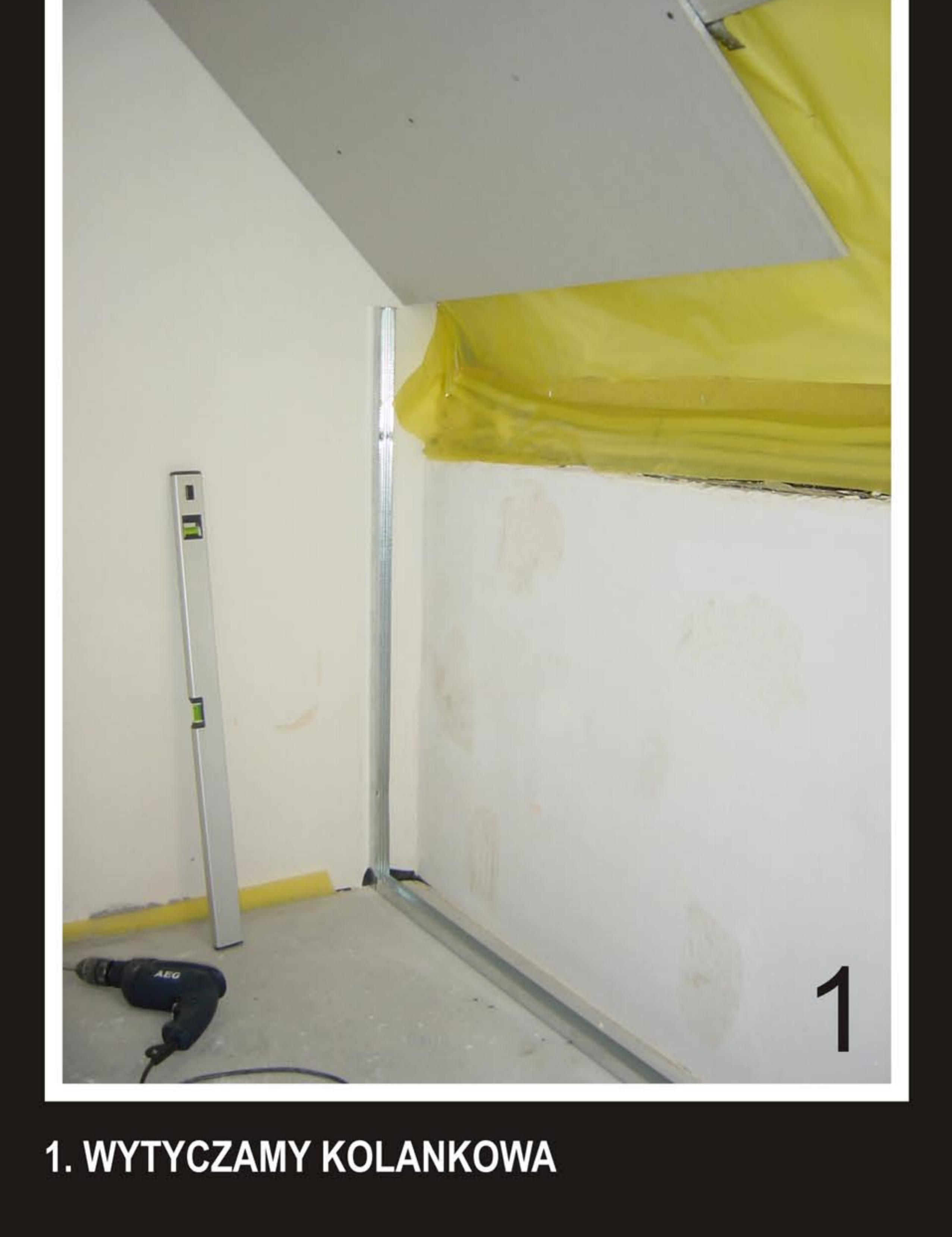
1. WYTYCZAMY KOLANKOWA

W INNYM PRZYPADKU ZAMKNIĘCIE W SYSTEMIE V-3.1 Z WOLNYM CD 60 FOT. 1,2,3,4,5.