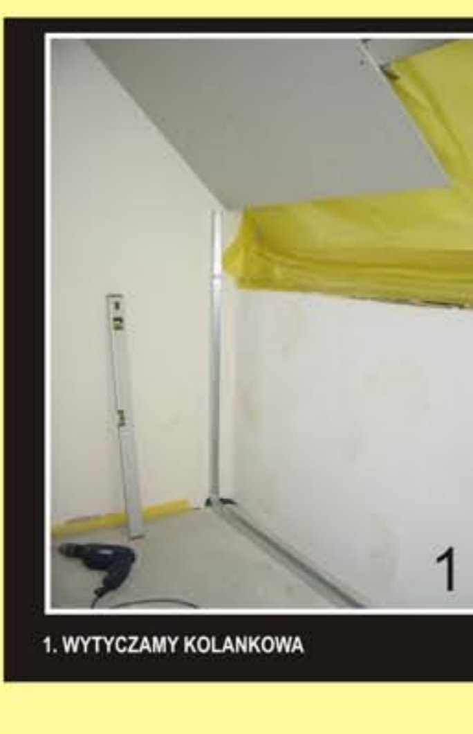
1. WYTYCZAMY KOLANKOWA

ZALECANA KOMBINACJA ZAMKNIĘCIA Z PODWIESZONYM CD 60 NA WIESZAKACH. V-1 W INNYM PRZYPADKU ZAMKNIĘCIE W SYSTEMIE V-3.1 Z WOLNYM CD 60 FOT. 1,2,3,4,5.