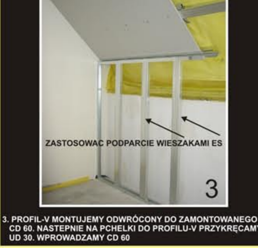
3. PROFIL-V MONTUJEMY ODWRÓCONY DO ZAMONTOWANEGO CD 60. NASTĘPNIE NA PCHELKI DO PROFILU-V PRZYKRĘCAMY UD 30. WPROWADZAMY CD 60