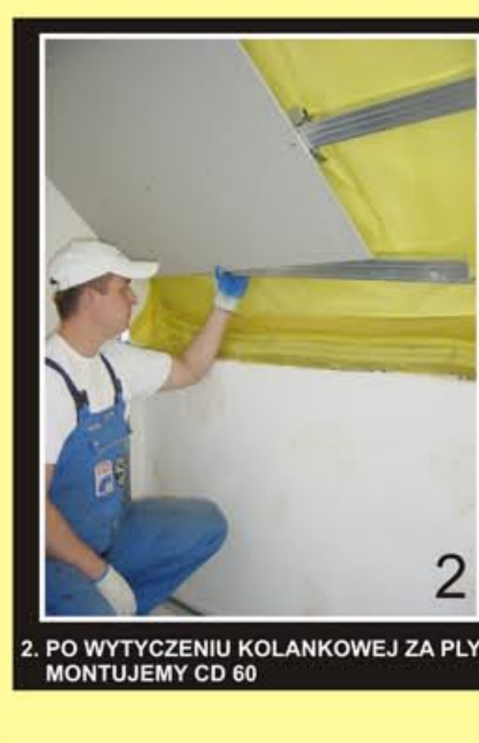
2. PO WYTYCZENIU KOLANKOWEJ ZA PLYTĄ MONTUJEMY CD 60