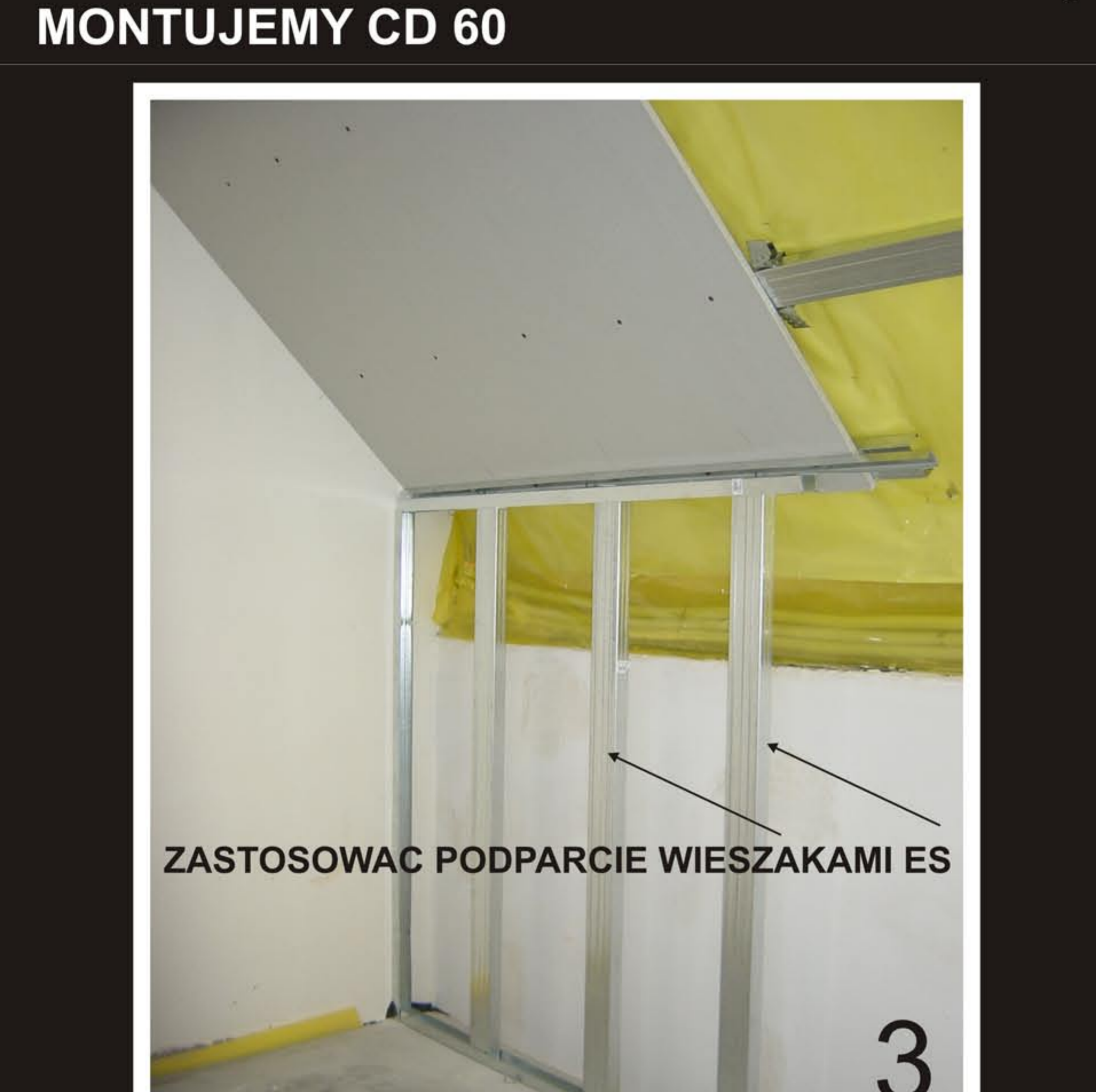
3. PROFIL-V MONTUJEMY ODWRÓCONY DO ZAMONTOWANEGO CD 60. NASTĘPNIE NA PCHELKI DO PROFILU-V PRZYKRĘCAMY UD 30. WPROWADZAMY CD 60