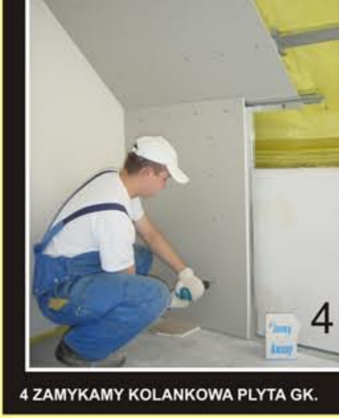
4 ZAMYKAMY KOLANKOWA PLYTA GK.