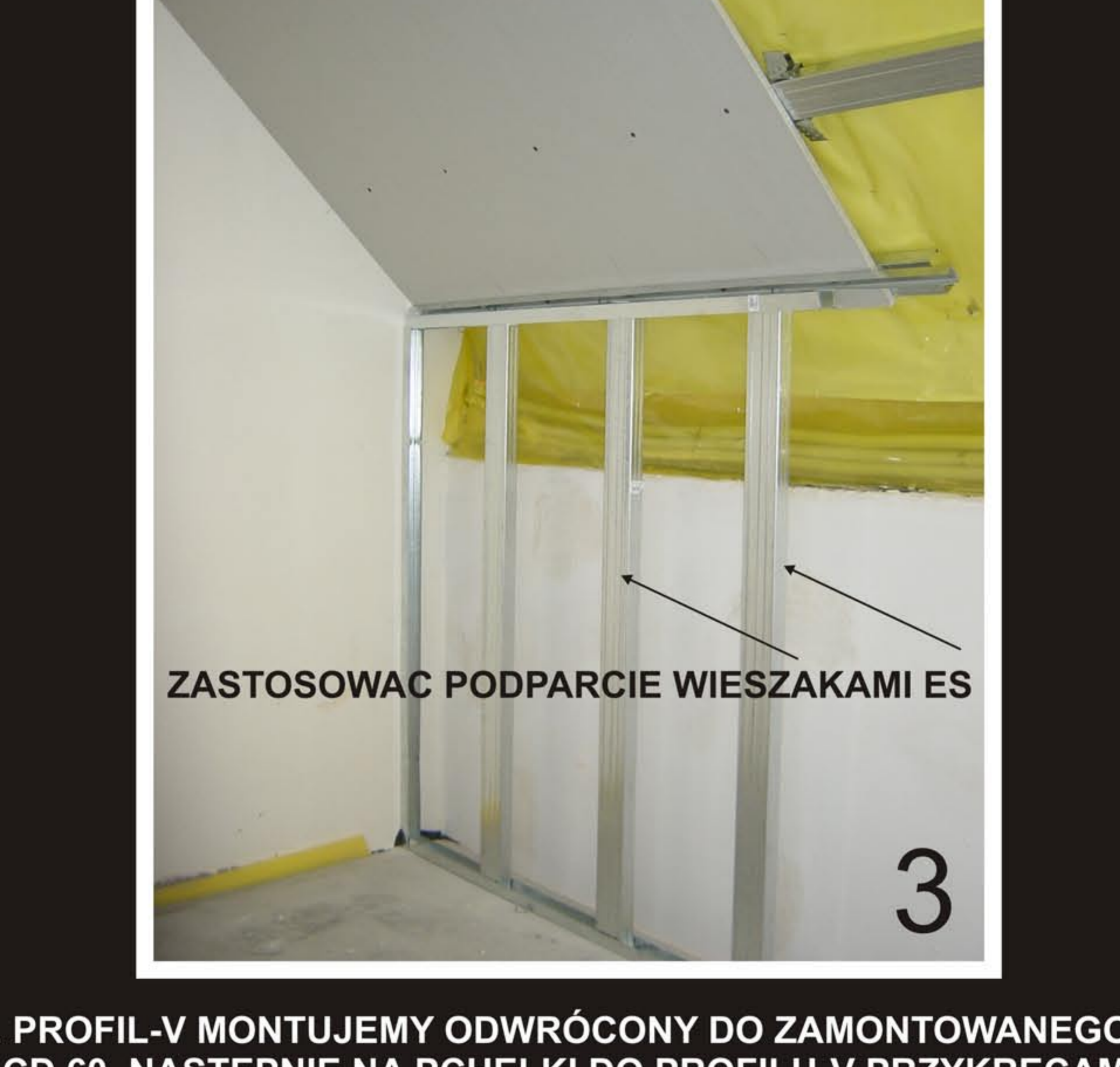
3. PROFIL-V MONTUJEMY ODWRÓCONY DO ZAMONTOWANEGO CD 60. NASTĘPNIE NA PCHELKI DO PROFILU-V PRZYKRĘCAMY UD 30. WPROWADZAMY CD 60