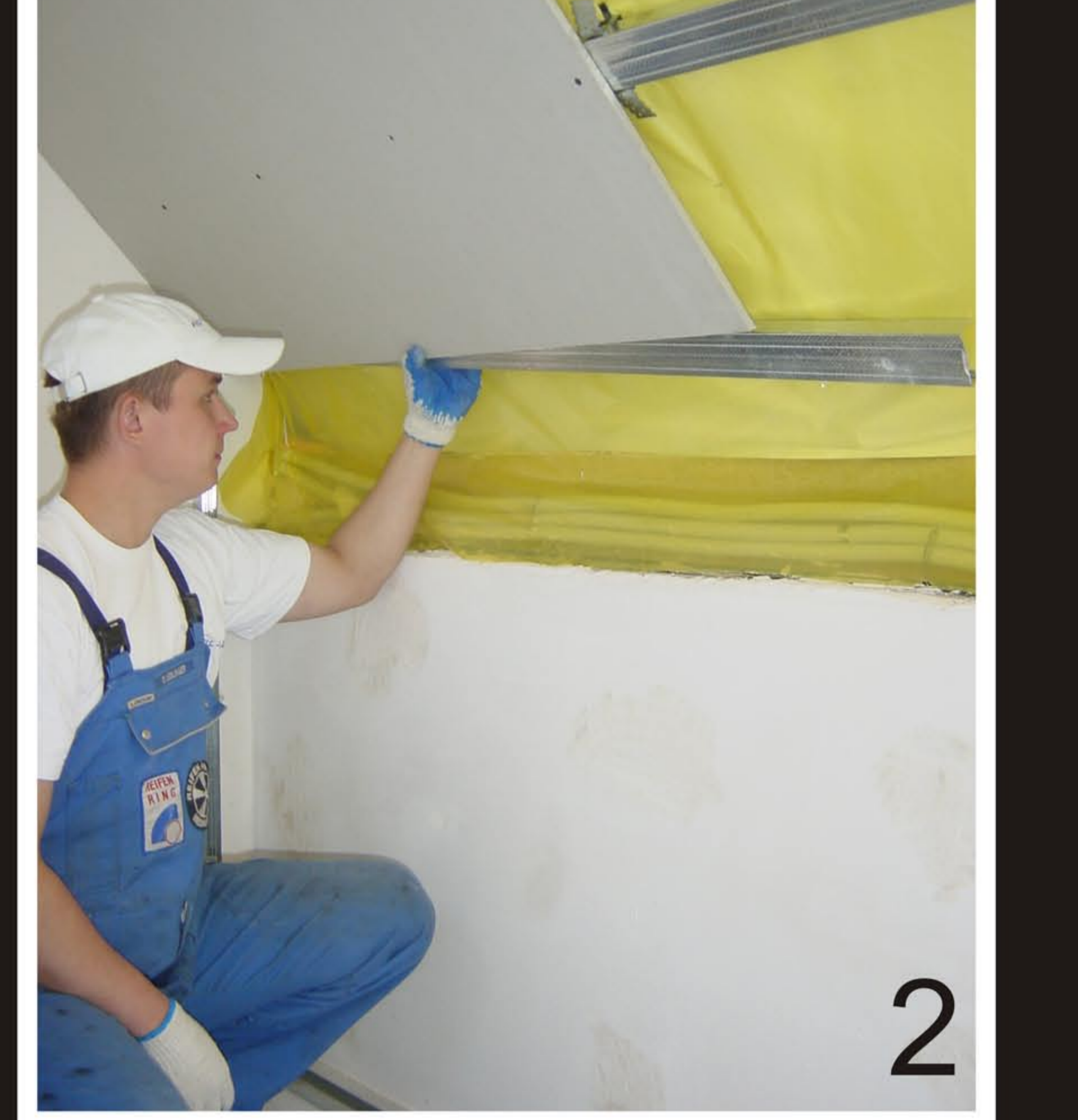
2. PO WYTYCZENIU KOLANKOWEJ ZA PLYTĄ MONTUJEMY CD 60