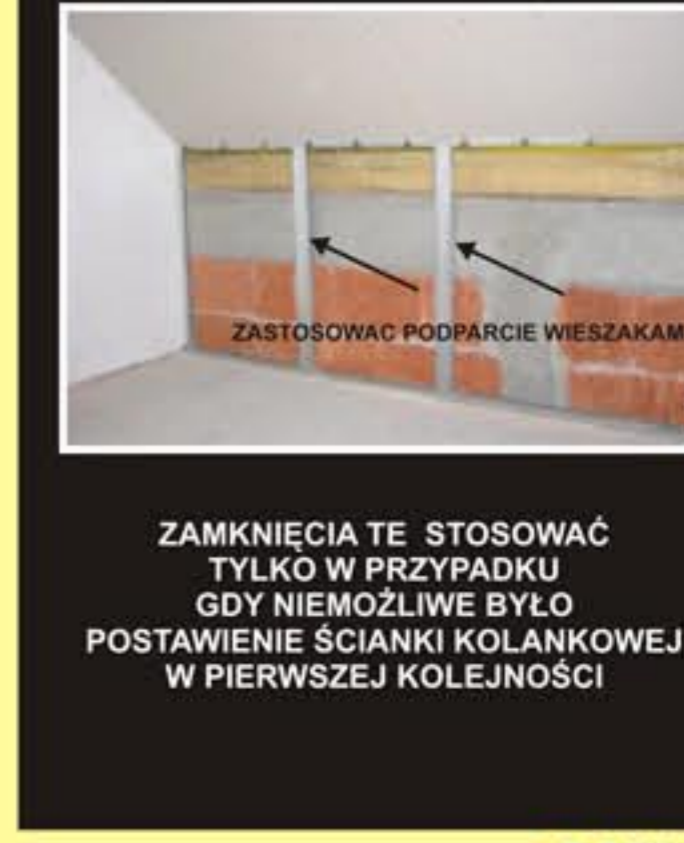
5. EWENTUALNA KOMBINACJA NR. 2

ZAMKNIĘCIA TE STOSOWAĆ TYLKO W PRZYPADKU GDY NIEMOŻLIWE BYŁO POSTAWIENIE ŚCIANKI KOLANKOWEJ W PIERWSZEJ KOLEJNOŚCI