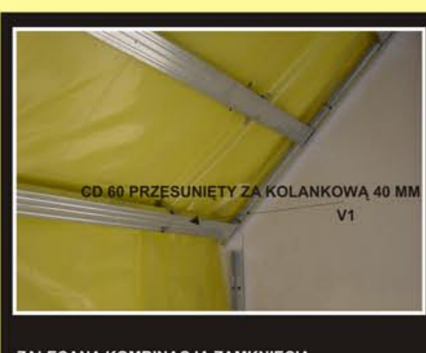
CD 60 PRZESUNIĘTY ZA KOLANKOWĄ 40 MM V1

ZALECANA KOMBINACJA ZAMKNIĘCIA Z PODWIESZONYM CD 60 NA WIESZAKACH. V-1 W INNYM PRZYPADKU ZAMKNIĘCIE W SYSTEMIE V-3.1 Z WOLNYM CD 60 FOT. 1,2,3,4,5.