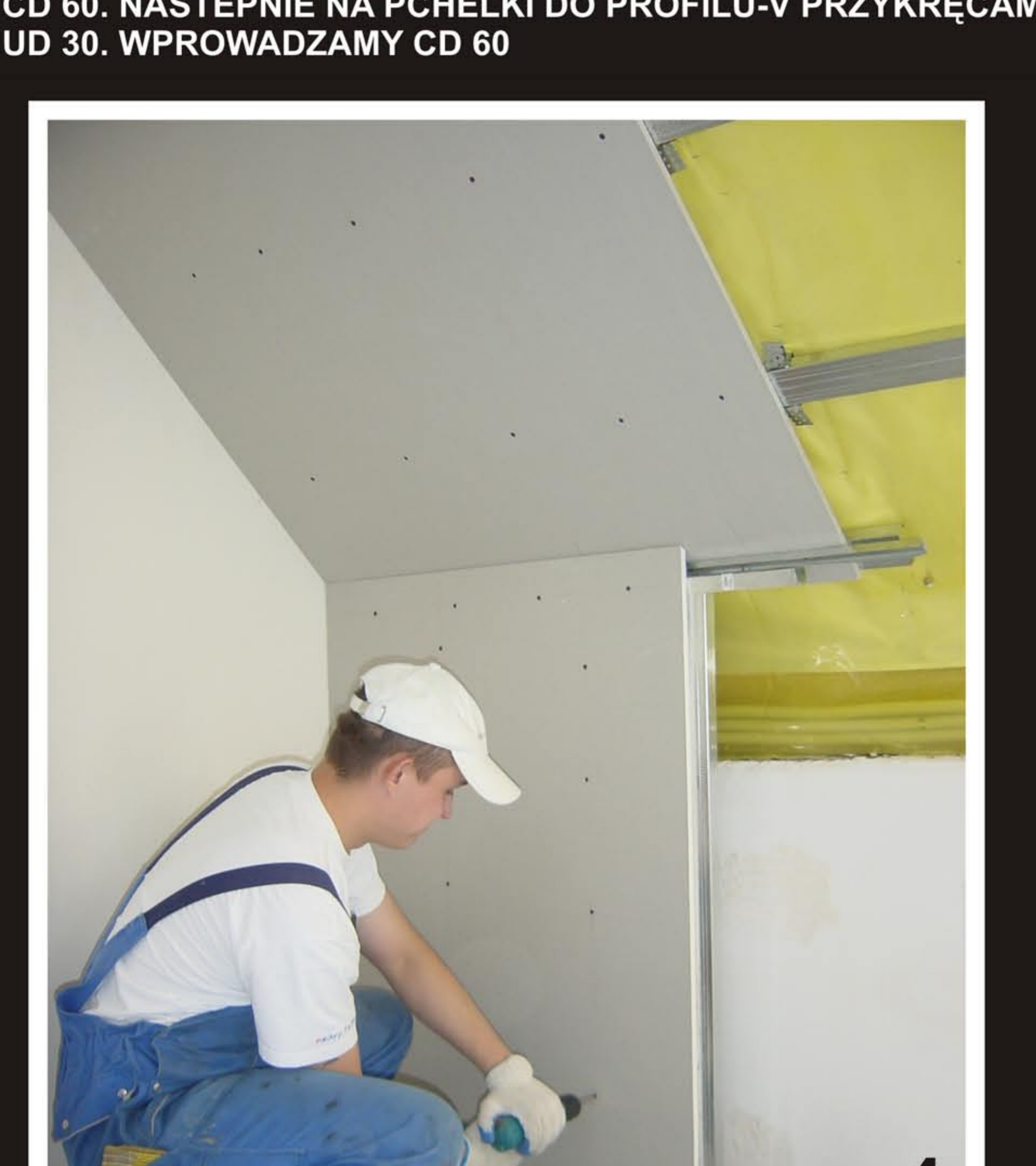
4 ZAMYKAMY KOLANKOWA PLYTA GK.