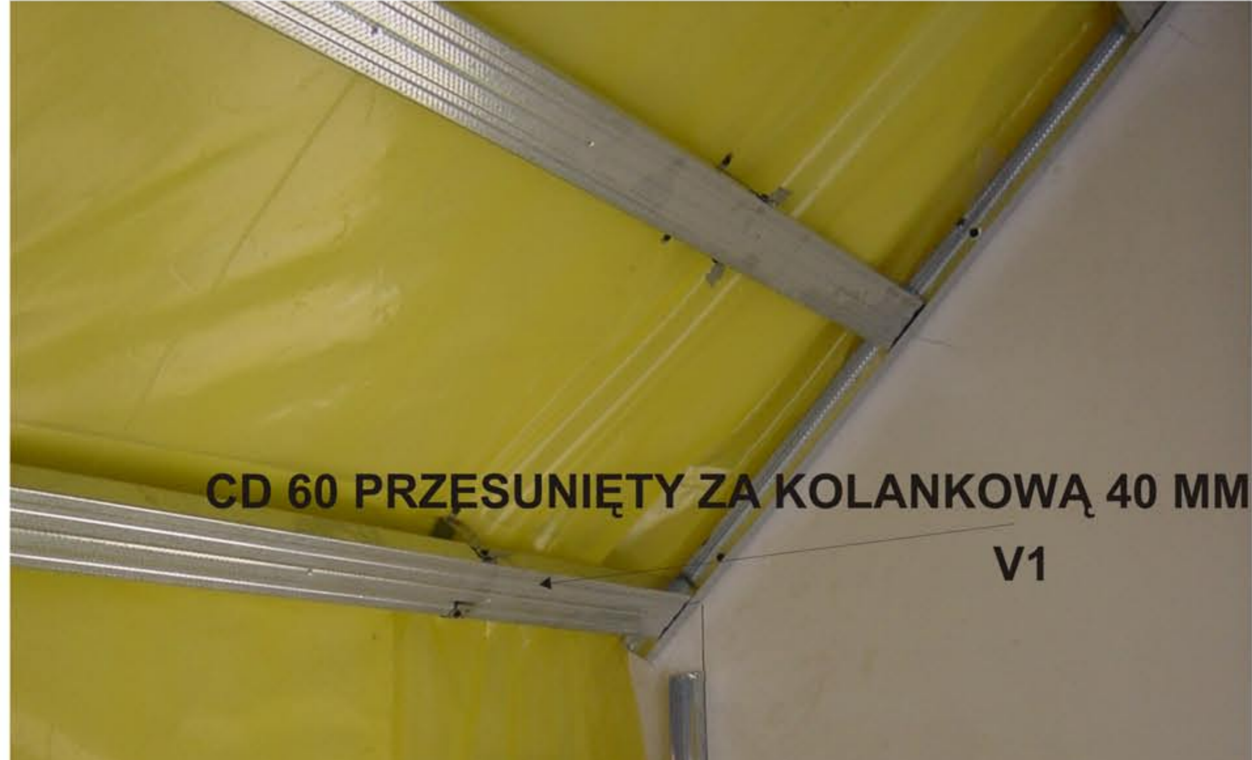
CD 60 PRZESUNIĘTY ZA KOLANKOWĄ 40 MM V1